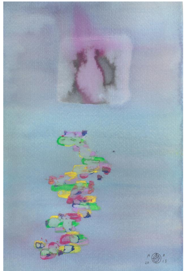
Sinestesia di Roberto Matarazzo