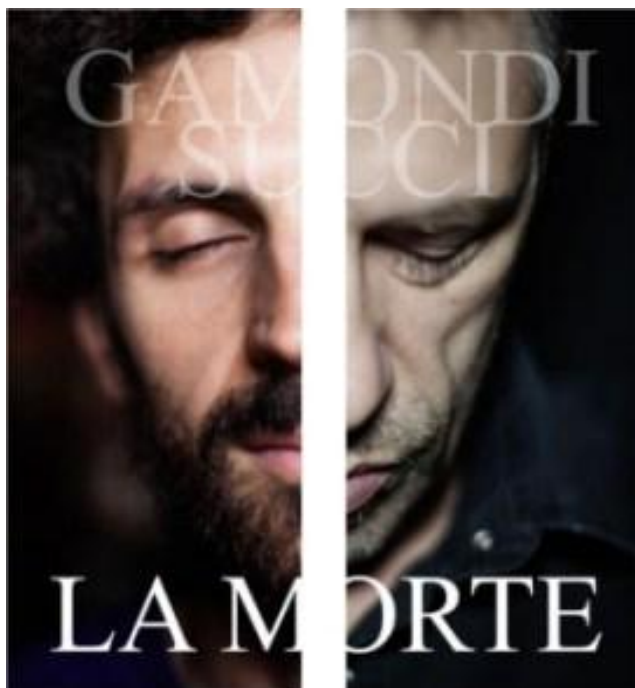
La Morte (2012)

In un mondo in cui si racconta sempre e solo di vita (a volte sprecata, a volte vissuta), perché non dare spazio alla morte, a quello che nessuno mai si sogna di cantare, al mistero di quello che sarà? Uocki Toki (al secolo Riccardo Gamondi) deve aver pensato proprio questo quando ha chiesto a Giovanni Succi (dei Bachi da Pietra) di selezionare alcuni brani letterari che trattassero l'argomento. Il progetto, uscito il 2 novembre, del tema ha preso anche il nome: La Morte.